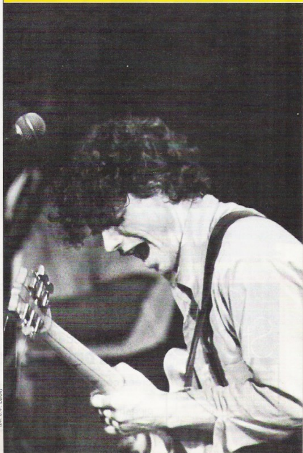
(D.R. J.-P. Lefort)